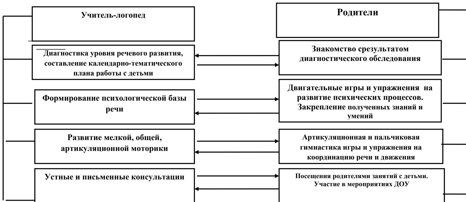
Модель взаимодействия учителя-логопеда с родителями

Без постоянного и тесного взаимодействия с семьями воспитанников коррекционная логопедическая работа будет не полной и не достаточно эффективной. Поэтому интеграция детского сада и семьи – одно из основных условий работы учителя-логопеда в группе для детей с нарушениями речи. Модель взаимодействия с семьями детей, имеющими нарушения речи, представлена на схеме